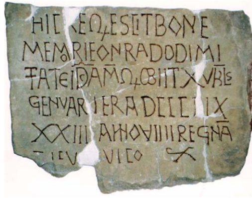
Frescos d'Ignasi M. Serra al temple de Sant Pere de Gavà, i placa d'Honrat, del segle X

Davant d'aquests fets, formulem el següent