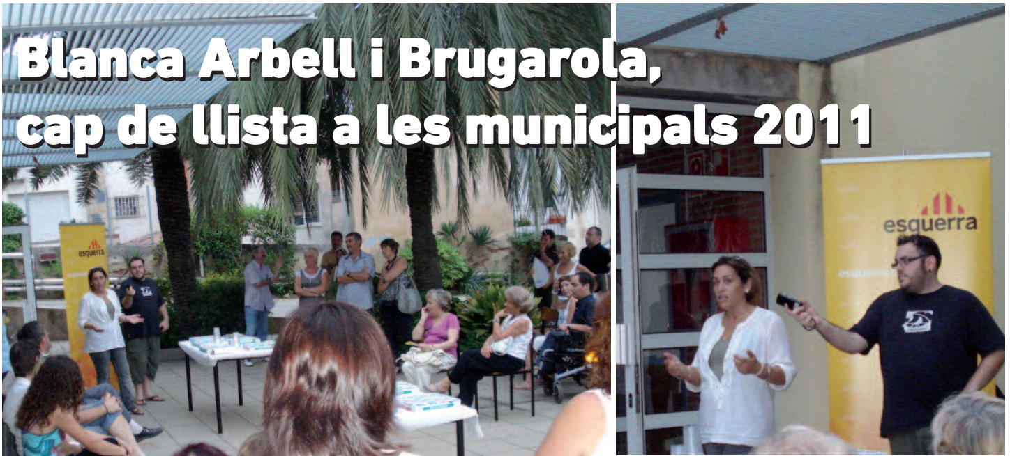
Presentació pública de la Blanca davant una setantena de persones