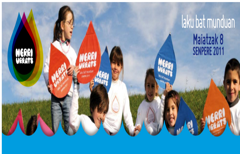
Cartell de la festa d'Herri Urrats, associació de sosteniment a les ikastoles d'Iparralde