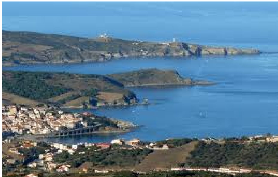
La Costa Vermella i Banyuls de la Marenda.