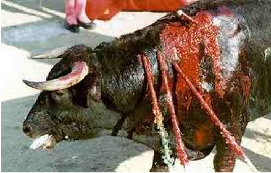
La sang, la tortura i la mort, patrimoni cultural de França.