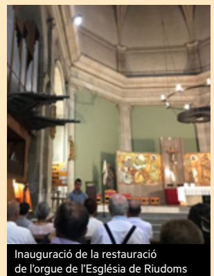
Inauguració de la restauració de l'orgue de l'Església de Riudoms