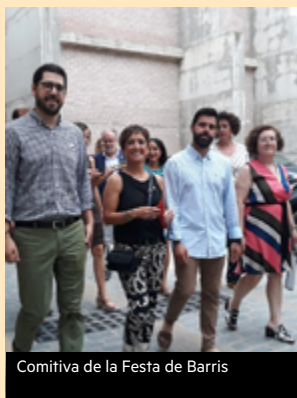
Comitiva de la Festa de Barris

Amb la voluntat de ser a prop teu i sobretot de les entitats, les darreres setmanes hem assistit com a regidors a diversos dels actes que s'organitzen a Riudoms. Us en deixem un tastet.