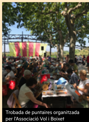
Trobada de puntaires organitzada per l'Associació Vol i Boixet