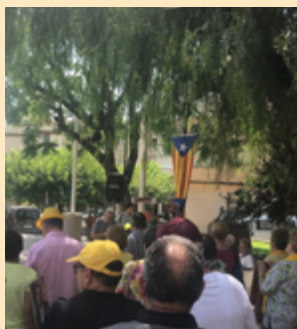
Concentració dels dissabtes dels Avis i Avies per la Llibertat