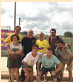
Torneig de futbol de penyes del Barça organitzat per la Penya Avellana Blaugrana i el CD Riudoms

Et recomanem que abans ens escriguis a riudoms@esquerra.cat