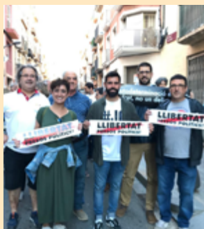
Manifestació a Reus pel final del judici contra els presos polítics