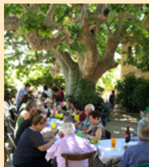
Dinar d'Esquerra Riudoms després de les eleccions