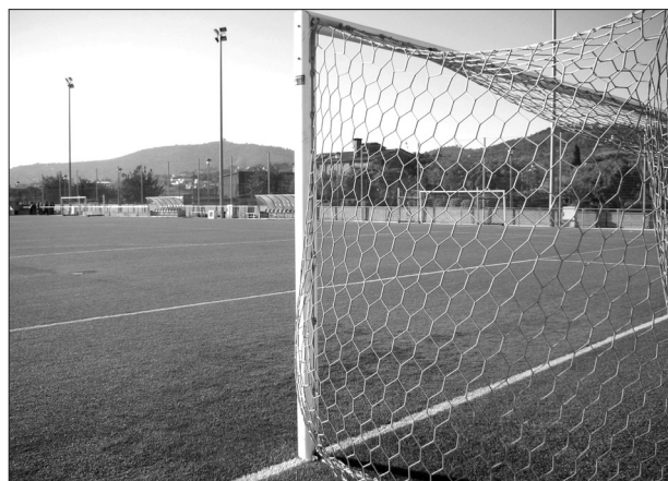
20€/any/esportista per trepitjar la gespa del camp de futbol

Si senyor. D'això se'n diu "treballar per una major col·laboració amb les entitats esportives per reforçar uns importants motors de foment de l'esport i de l'educació d'infants i joves del municipi", una altra de les grans frases del programa electoral de Progrés.