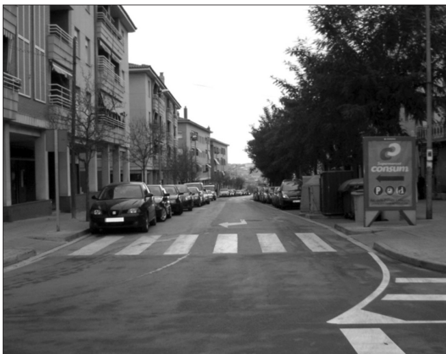
Avinguda Santa Coloma: d'eix principal a carrer de segona

Amb aquesta actuació uns es donen per pagats i els altres per lliurats del deute. Però no tothom n'ha quedat satisfet. Sobretot els usuaris de l'autobús, els conductors que cada matí suporten retencions que ja tenien oblidades i una majoria de comerciants que, sorpresos, veuen com l'avinguda on radiquen ha passat de ser un eix principal a un carrer de segona.