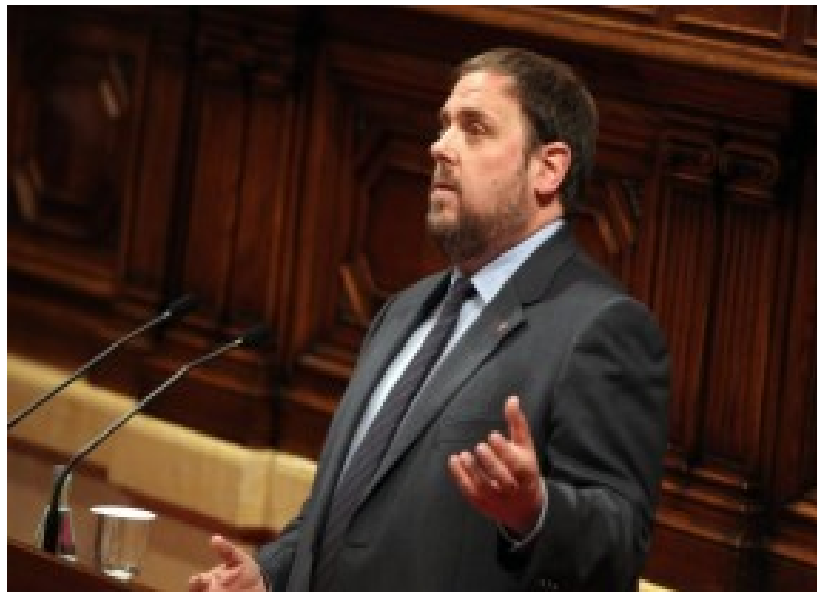
Oriol Junqueras durant la intervenció en el debat d'investidura al Parlament

Junqueras ha explicat que la voluntat d'ERC i del pacte d'estabilitat té com a un dels objectius prioritaris la reactivació econòmica centrada en els àmbits decisius de creixement econòmic i que poden donar un ampli consens a la cambra, amb un paper decisiu de la recerca, l'ensenyament, la innovació i la internacionalització. Respecte de les reformes fiscals Junqueras ha explicat que 'no només tenen l'afany d'incrementar ingressos i suavitzar les retallades sinó la finalitat de reactivar l'economia incentivant el consum i la inversió'. Pel que fa a les retallades Junqueras ha volgut de nou deixar clar que 'és l'Estat espanyol qui estableix el sostre de dèficit que obliga a fer aquestes retallades tan dures i qui nega a les comunitat autònomes el repartiment de la flexibilització que rep de la unió europea'.