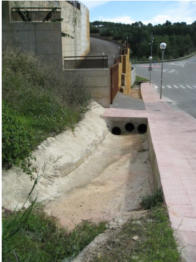
Figura 2. Estat actual del desguàs del torrent de la Sentiu al final del seu recorregut, amb el pas per a l'aigua (els tres forats) reservat en el moment d'aixecar la nova casa.