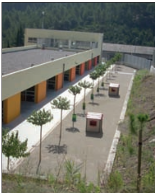
Escola El Cau de la Guineu