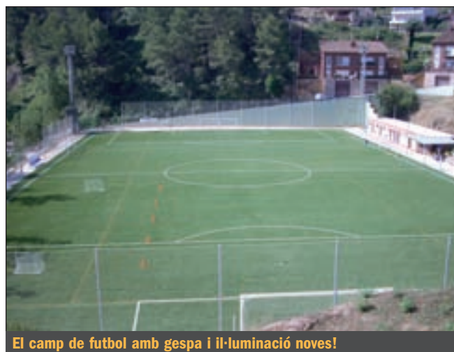
El camp de futbol amb gespa i il·luminació noves!