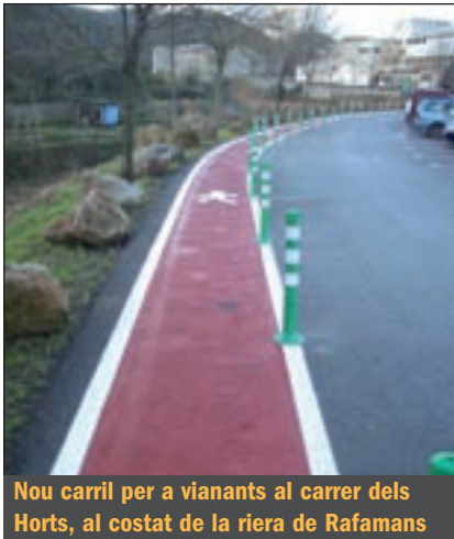
Nou carril per a vianants al carrer dels Horts, al costat de la riera de Rafamans