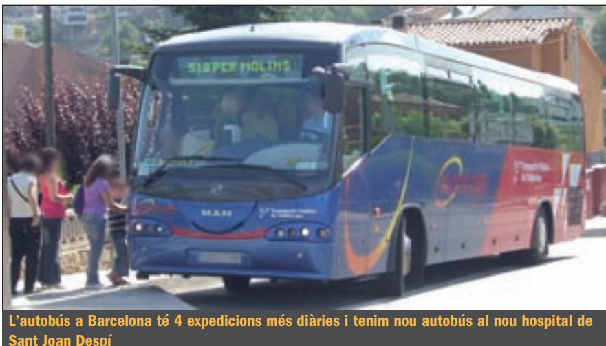
L'autobús a Barcelona té 4 expedicions més diàries i tenim nou autobus al nou hospital de Sant Joan Despí