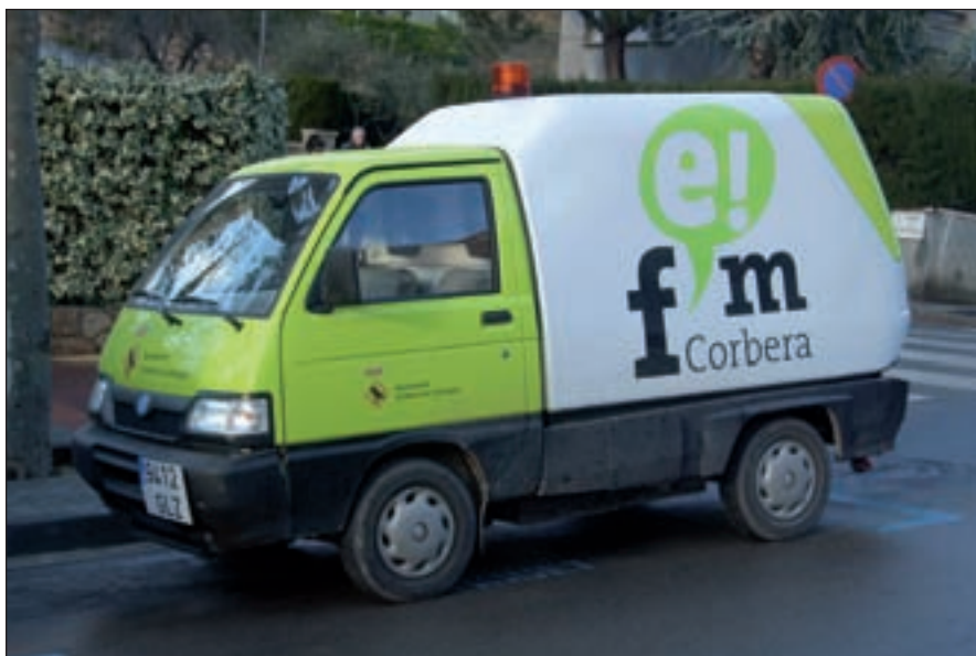
Fem Corbera amb més contenidors i més vehicles de neteja

• Hem creat una carpeta per a les entitats amb indicacions i serveis que dona l'ajuntament per fer els seus actes més sostenibles i amb menys residus.