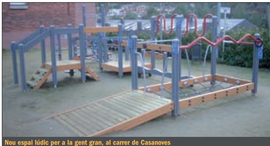
Nou espai lúdic per a la gent gran, al carrer de Casanoves