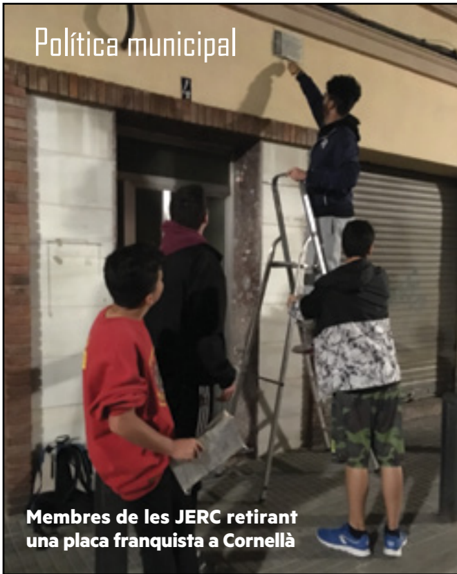
Membres de les JERC retirant una placa franquista a Cornellà