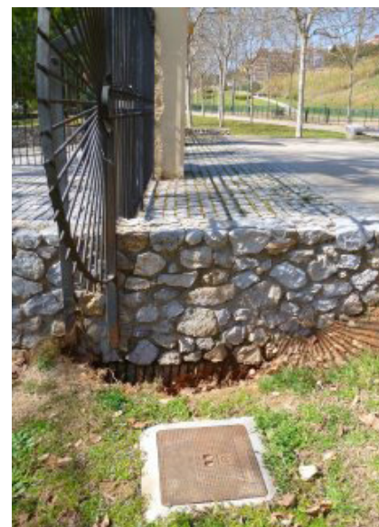
El pont enterrat del Canal de la Infanta a l'entrada de Can Mercader

http://canaldelainfanta.blogspot.com/ http://www.facebook.com/groups/canalinfantalh/