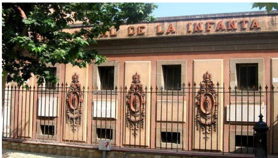
Casa de Comportes - Molins de Rei

El Canal de la Infanta, inaugurat el 21 de maig del 1819 per la Infanta M a Luisa Carlota Joaquina de Borbón i Dos Sicilies, obra hidràulica històrica, que va revolucionar l'agricultura de regadiu, la indústria i va empènyer exponencialment el nivell de vida de la població del Baix Llobregat, està d'actualitat a pocs anys del seu bicentenari.