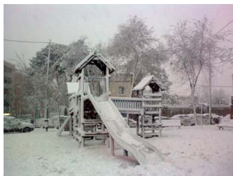
La plaça dels Capgrossos el 8 de març