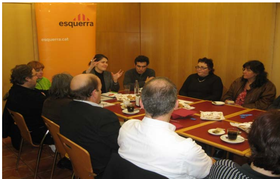
La Llei de Comerç, una eina al servei del comerç de proximitat.