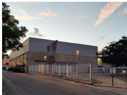
Poliesportiu de la Canonja

Per ERC La Canonja, aquests fets demostren una clara manca de sensibilitat cap al teixit associatiu canongí per part del PSC, que lidera el govern municipal. Per això, demanem que l'Ajuntament de la Canonja vetlli perquè cap entitat canongina hagi d'anar a desenvolupar la seva activitat esportiva fora del nostre municipi , per manca d'hores en els centres esportius o espais. També exigim transparència a l'hora d'assignar les hores en els centres esportius, com en el Poliesportiu, de manera que tots els usuaris puguin contemplar les opcions existents.