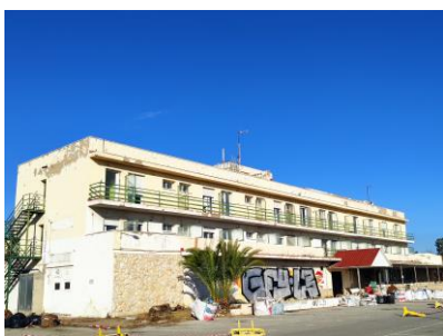
Sant Vicenç Ferrer

La llista de la compra s'allarga considerablement, podent citar la compra del Sant Vicenç Ferrer, finques al camí de les Pletes, al carrer Bisbe Borràs, al carrer Raval, a la Plaça Europa, al polígon, una expropiació al carrer Ravaleta i podríem continuar.