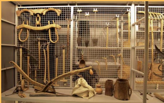
Març 2011, vista interior de les vitrines