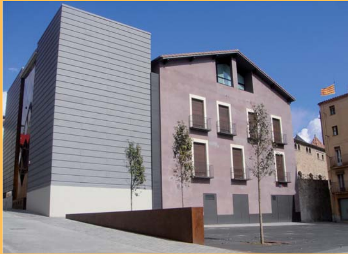
Març 2011, vista des de la plaça Abat Arnulf

Motiu d'orgull per a tots els ripollesos