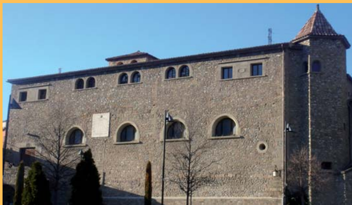
Teulada de l'església de Sant Pere rehabilitada el 2005