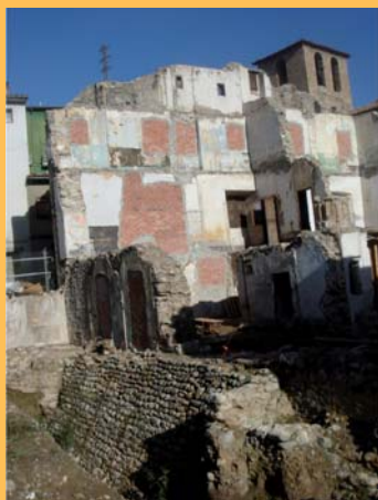
→ Desembre 2006